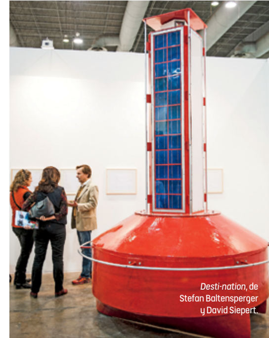
Desti-nation, de Stefan Baltensperger y David Siepert.