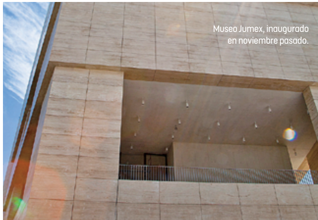
Museo Jumex, inaugurado en noviembre pasado.