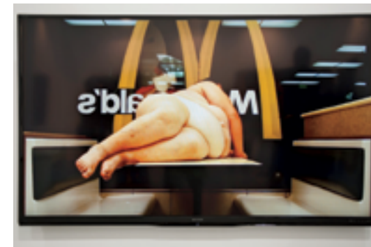
Detalle de la obra de Liliana Porter, Trabajo forzado.

Además de la curaduría para Zona Maco Sur, Gaitán moderará hoy jueves (16 h) una de las conferencias de la feria, llamada “Lo permanente y lo temporal: