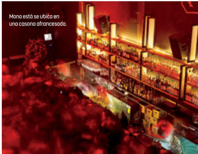
Mono está se ubica en una casona afrancesada.