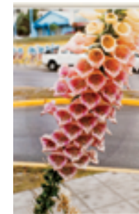
ENTRE LOS MÁS COTIZADOS Wolfman Tillmans y su obra Ushuai Digitalis .

Definitivamente, Basilea: es muy grande, ha tenido grandes directores y se instala en un hermoso recinto; la oferta es inmensa y asisten coleccionistas de todo el mundo. Además, tiene la ventaja de estar en el centro de Europa; esa ubicación geográfica es estratégica porque varias ciudades importantes, como París, están muy cerca y son importantísimas para el coleccionismo.